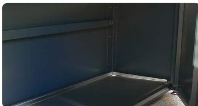
Dno iz nerjavečega jekla je nagnjeno navznoter, da preprečuje razlitje.