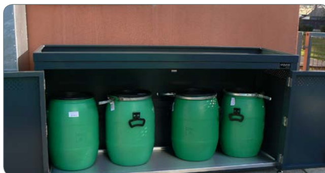
Vrata omogočajo 180° odpiranje, zaradi česar bo dostop do sodov enostavnejši.