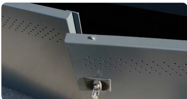
Vsebino imate lahko vedno pod nadzorom, saj ima omara BIOBOX integrirano ključavnico.