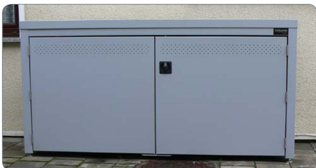
Kakovostna konstrukcija iz kvalitetnih materialov zagotavlja odpornost na vremenske vplive.